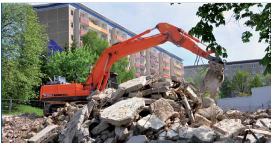
Stadtumbauten in Sachsen-Anhalt passen das Stadtbild an die neuen Anforderungen an.

überall die leitungsgebundene Trink- und Abwasser-, die Gesundheits- oder ÖPNV-Versorgung gewährleistet werden können, der irrt gewaltig, weil dies nicht finanzierbar sein wird. Es muss daher Projekte in Modellstädten geben, die die voraussichtliche Lage im Jahr 2025 oder 2030 abbilden. Offenheit gegenüber unabwendbaren Entwicklungen in vielen Gebieten unseres Landes ist Gebot der Stunde, um einerseits Fehlentscheidungen der Bürger, aber auch Fehlinvestitionen der öffentlichen Hand und der Wirtschaft zu vermeiden. Und wir werden erleben, dass sich in den Regionen mit schlechten Perspektiven viel ehrenamtliches Engagement entwickelt, was nur zu begrüßen ist. Die Zeit des „All-inclusive“-Denkens der Bürger, dass immer alles, an jedem Ort und in gleicher Weise zur Verfügung steht, wird der Vergangenheit angehören müssen.