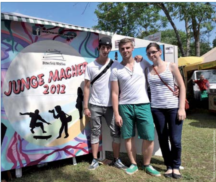
„Junge Macher“ stellen ihre Projekte beim 21. Vereins- und Familienfest in Bitterfeld-Wolfen vor.