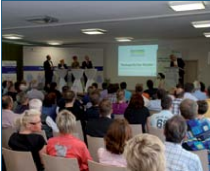
Bürgerforum im Dorfgemeinschaftshaus in Hermsdorf (Gemeinde Hohe Börde, 2011)

Kommunen im ländlichen Raum legen erste Handlungsprogramme zur Gestaltung des demografischen Wandels vor