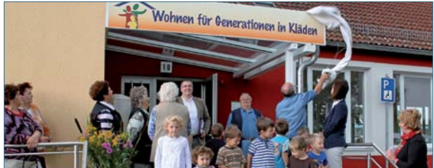
Wohnen für Generationen - Umbau der ehemaligen Sekundarschule im Ortsteil Kläden der Einheitsgemeinde Stadt Bismark (Altmark, 2011)

Anpassungsstrategien stellen sich als notwendige informelle Planungsdokumente heraus, um sowohl Politik und Verwaltung als auch die interessierte Öffentlichkeit für die Folgewirkungen des demografischen Wandels zu sensibilisieren. Nachweisbar ist in diesem Zusammenhang, dass kommunale Akteure bei der Befassung mit dem Thema „enger zusammenrücken“. Zu diesem Ergebnis kommen die Autoren zweier Untersuchungen aus dem ländlichen Raum Sachsen-Anhalts. Von Dezember 2010 bis Januar 2012 wurden in den Einheitsgemeinden Hohe Börde (Landkreis Börde) und Stadt Bismark/Altmark (Landkreis Stendal) Strategien für die Gestaltung des demografischen Wandels erarbeitet. Die Modellprojekte wurden im Rahmen der „Demografie-Richtlinie“ des Landes durch das Ministerium für Landesentwicklung und Verkehr unterstützt.